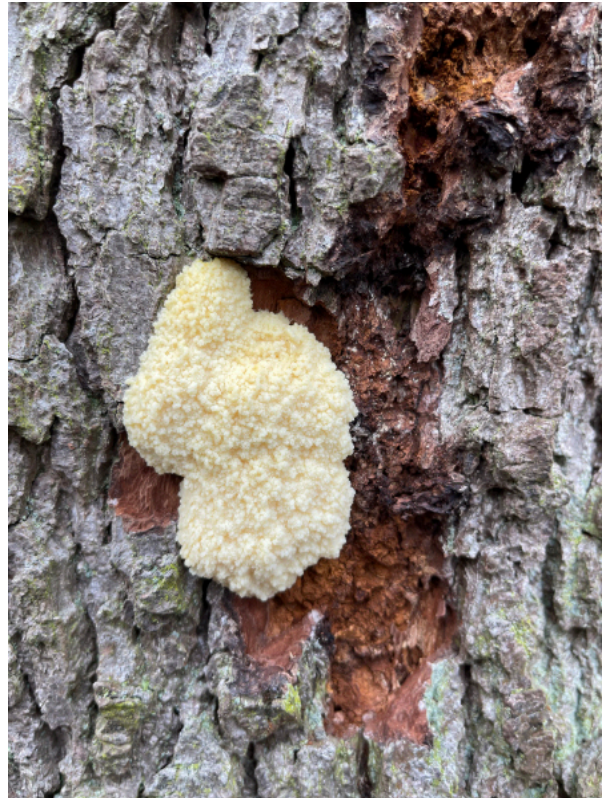
Gelbe Lohblüte - Schleimpilz